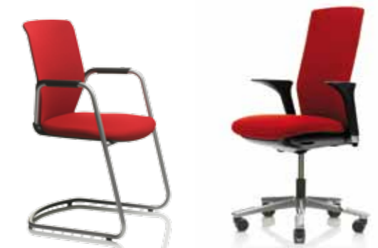
HÅG Futu Communication 1070