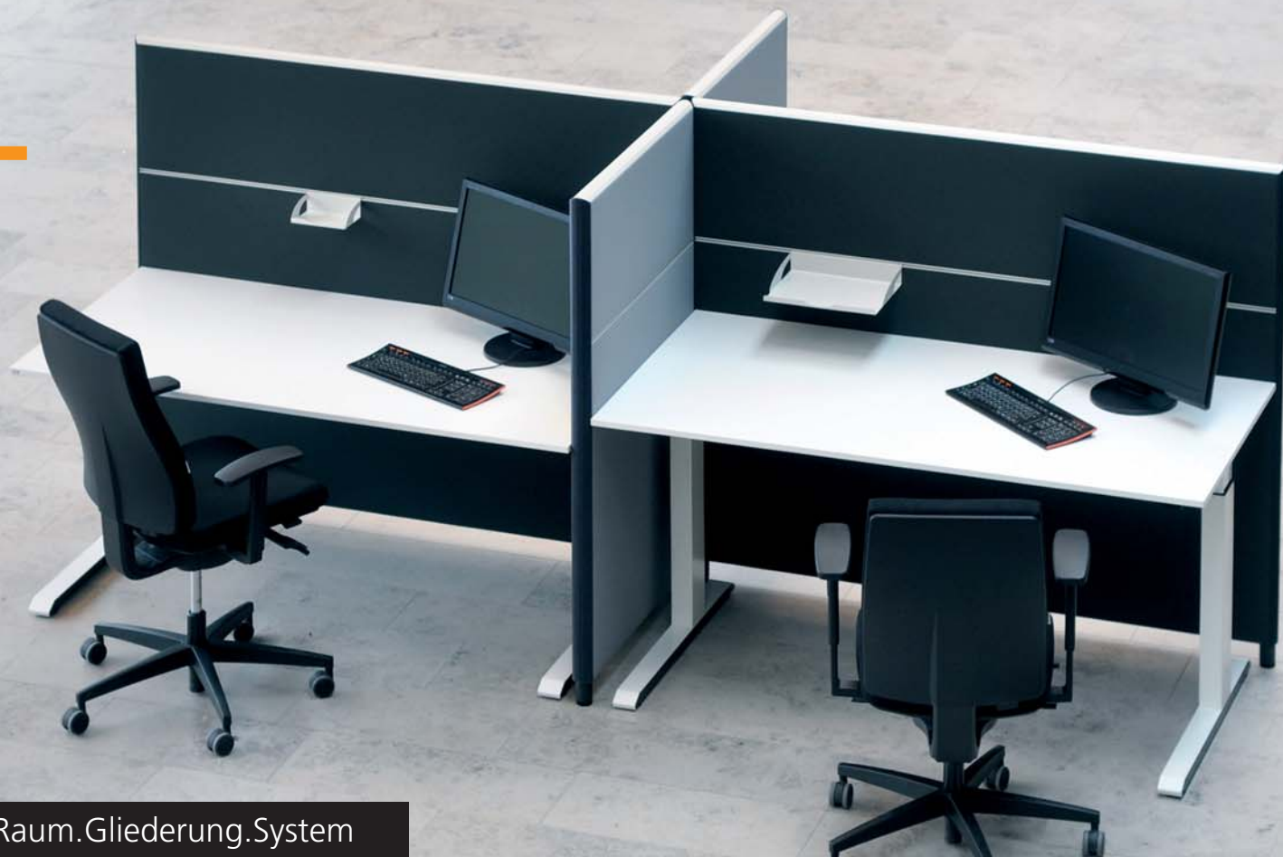
SILENCE LINE Raum.Gliederung.System